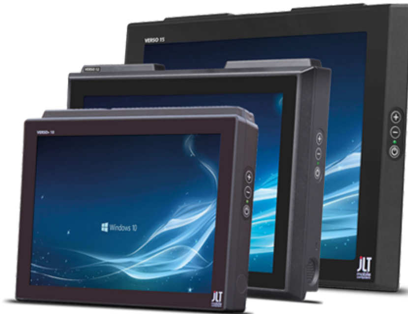
JLT1214x datorn för lager & logistik VERSO-serien för “Heavy-Duty”