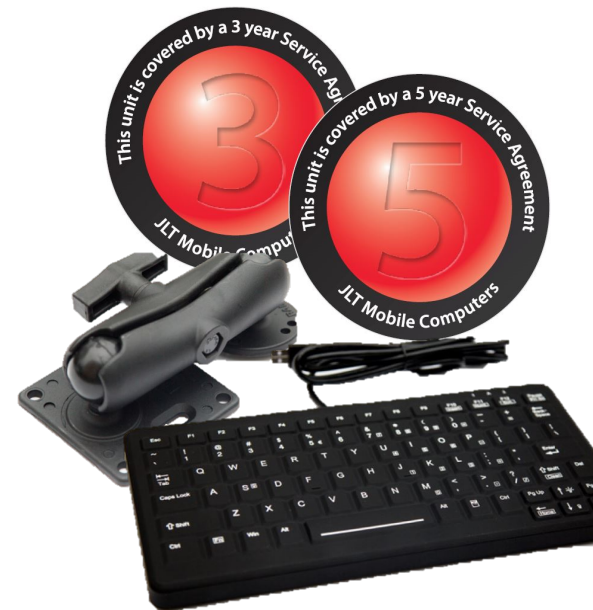
JLT:Care serviceavtal JLT:Works tjänster Tillbehör