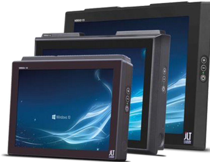
JLT1214x datorn för lager & logistik VERSO-serien för “Heavy-Duty”