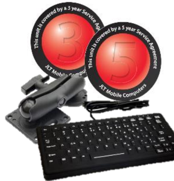
JLT:Care serviceavtal JLT:Works tjänster Tillbehör